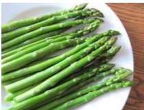
sumber: Mendelson, M. (tanpa tahun)

asparagus n tumbuhan Liliaceae , ujung akar tunggalnya (rebung) biasa dibuat sayur, terutama yang belum terkena sinar, berwarna putih, lunak, dan tebal ( asparagus )